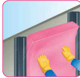
Presione hacia la cavidad.

*Si requiere longitudes especiales, favor de consultar a nuestro Departamento de Ventas.