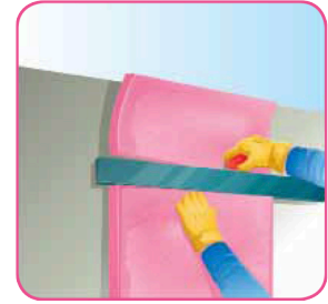
Corte el material excedente con una navaja o cuchillo con filo.

"Owens Corning proporciona estas instrucciones "tal y como están" y renuncia a cualquier responsabilidad por cualquier falta de precisión, omisión, error tipográfico causado por el equipo de terceras personas. Al utilizar estas recomendaciones, usted está aceptando estar sujeto a las disposiciones contenidas en este párrafo. Estas recomendaciones proporcionan un método ilustrativo para instalar Aislhogar y/o accesorios de Owens Corning. Las instrucciones de Owens Corning no tienen por objeto resolver toda contingencia posible que pudiera presentarse durante la instalación ni recomendar el uso de una herramienta en particular. Por la presente, Owens Corning renuncia expresamente a toda responsabilidad por cualquier reclamación por lesiones o fallecimiento relacionados o derivados por el uso de estas recomendaciones de instalación y de otras instrucciones de instalación que Owens Corning haya proporcionado de alguna otra forma".